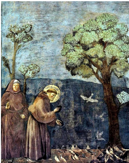
Franziskus predigt den Vögeln.

Dieses Jahr jährt sich der Todestag des Heiligen zum 800. Mal. Das Jubi-