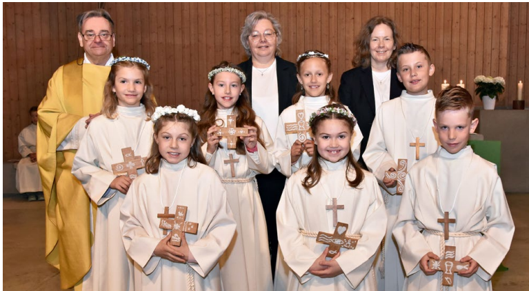
7 Erstkommunionkinder von Kägiswil.