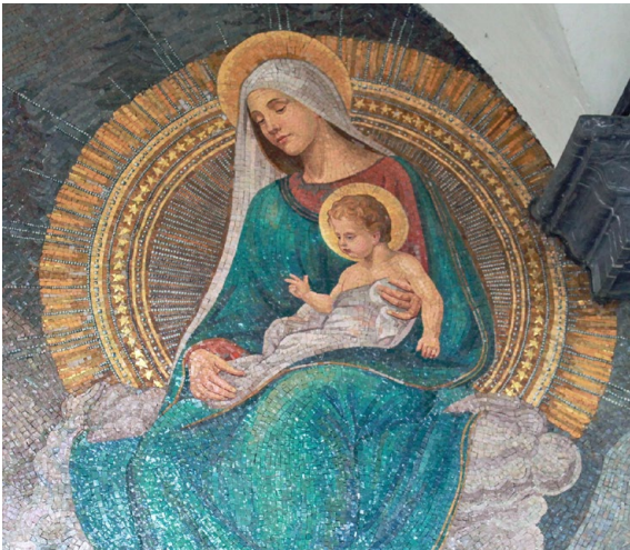
Das Marienmosaik beim Hauptportal der Pfarrkirche.

Der Mai ist in besonderer Weise der Monat der Muttergottes. Die aufblühende Natur, das Licht und die Wärme dieser Zeit lassen etwas von jener Hoffnung aufscheinen, die wir mit ihr verbinden: Vertrauen auf Gott, Offenheit für sein Wirken und die Bereitschaft, seinen Weg mitzugehen.