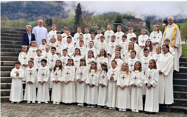
Unsere Erstkommunikanten 2026.