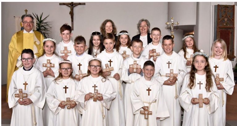
16 Kinder aus der Schwendi.

Zum ersten Mal haben 56 Mädchen und Buben aus der 3. Klasse die Hostie bei der Kommunion empfangen. Das Brot des Lebens ist eine Stärkung für das Herz und steht dafür, dass Gott mitten im Alltag begleitet. Die Kinder erlebten einen einheitlichen Vorbereitungsweg.