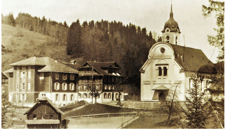
Ältere Leute erinnern sich bestimmt an die frühere Schwander Kirche.

Während bei der alten Kapelle äusserlich die ursprüngliche Form von