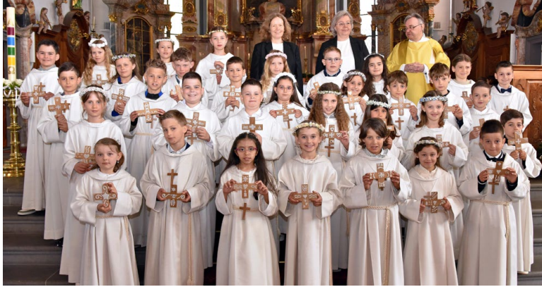
33 Kinder aus Sarnen und Wilen.